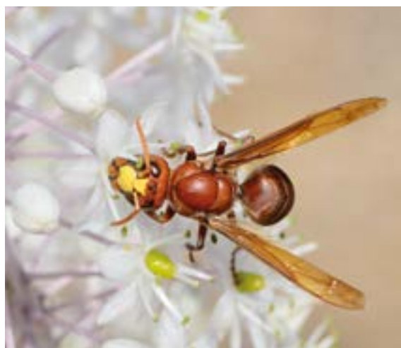
Frelon orientalis

Période d'activité : adultes observables en vol d'avril à novembre 5 .