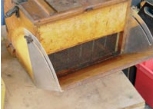
Ruchette de type Ruck-Zuck avec grille à reine pour filtrer les mâles et la reine