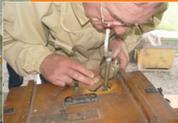
Enfumage au tabac