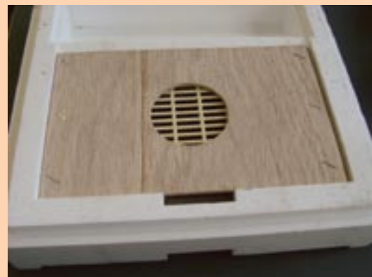
Adaptation du plancher avant insémination

La plupart de mes Mini-Plus ont une vitre placée sous le toit. Cela permet de juger tout de suite si la colonie est assez forte ou si elle a un problème de développement.