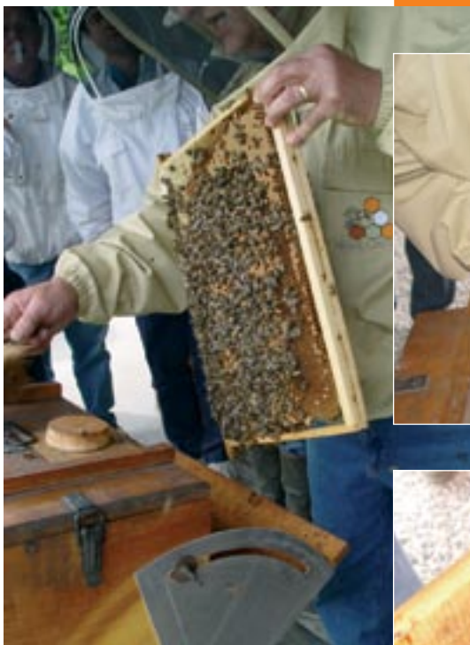
Secouage de cadres avec jeunes abeilles

On peut alors les prélever avec un pot de la capacité souhaitée en fonction du volume à occuper. Les abeilles restent plusieurs minutes endormies, ce qui vous laisse le temps de réaliser les peuplements.