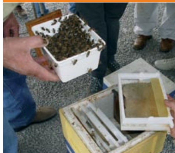
Peuplement des Mini-Plus