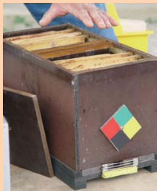
Ruchette Normal Maas avec demi-cadres de hausse.

À côté des Mini-Plus, on trouve des modèles plus petits : Kirchhain (Kieler), Apidea et une série de modèles à parois vitrées et à cadron unique. La Mini-Plus présente donc le volume le plus important (trois cadres de hausse DB, pour un cadre de hausse pour la Kirchhain et encore moins pour l'Apidea). Elle répond bien aux différents critères de choix si ce n'est le volume d'abeilles nécessaire pour son peuplement. Assez grande, cette ruchette va permettre de mieux vérifier l'état de la ponte de la reine, qui pourra y séjourner plus longtemps.