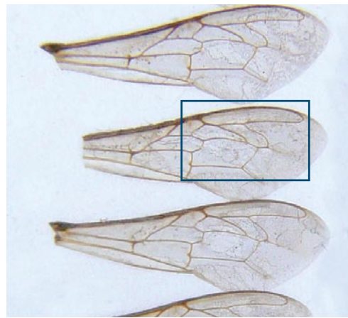
Fig.7a. Exemple d'écart discoïdal négatif, typique de l'abeille noire : le point Di se trouve du côté de l'attache de l'aile.

• Le déplacement discoïdal (DS) : c'est la position relative de la droite (h) perpendiculaire à la ligne K-J (grand axe de la cellule radiale) et passant par le point H, par rapport au point postérieur (Di) de la cellule discoïdale (D). Si le point Di se trouve du côté de la base (le point d'attache de l'aile sur le thorax), on considère que le DS est négatif (-) (Fig.7a). Si le point Di est plus ou moins sur la ligne, comme sur la Fig.6, on considère que le DS est nul.