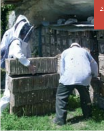
2. Retrait de la ruche de son emplacement.