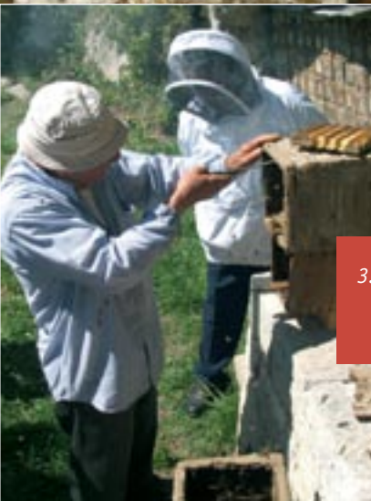
3. Découpe et retrait des rayons jusqu'aux premiers cadres de couvain.