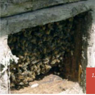
1. Sélection de la colonie à diviser sur base de la population.