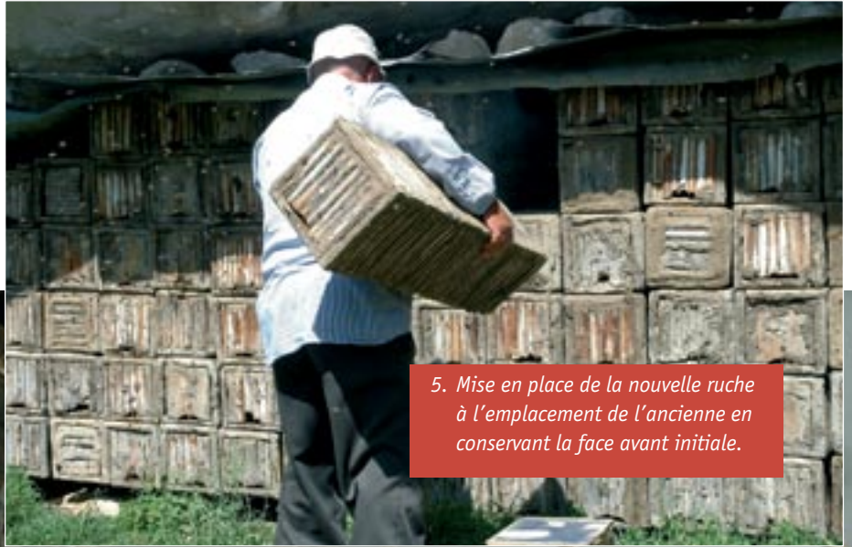
5. Mise en place de la nouvelle ruche à l'emplacement de l'ancienne en conservant la face avant initiale.