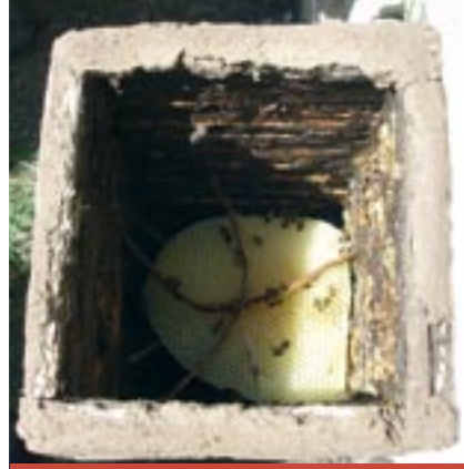
4. Mise en place des cadres de couvain prélevés dans la nouvelle ruche à l'aide de croisillons en bambou.