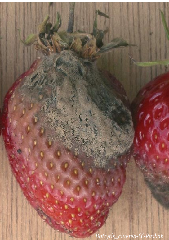
Botrytis cinerea