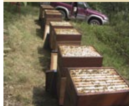
Emplacement 6 En raison de la forte infestation de varroas, impossibilité d'un développement printanier. Changement de reine après la miellée de printemps.