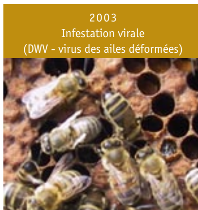
2003 Infestation virale (DWV - virus des ailes déformées)