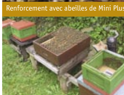
Renforcement avec abeilles de Mini Plus