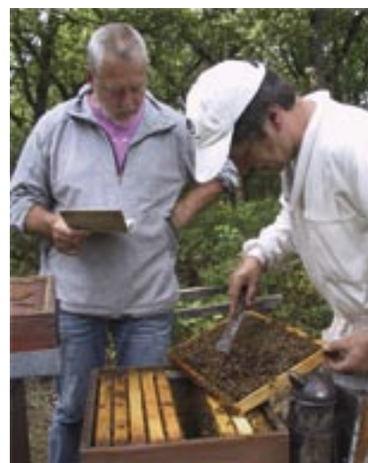
Contrôle par le Dr. Weis, 4 août 2005