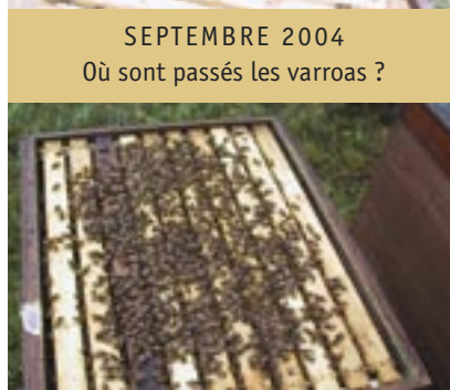
SEPTEMBRE 2004 Où sont passés les varroas ?