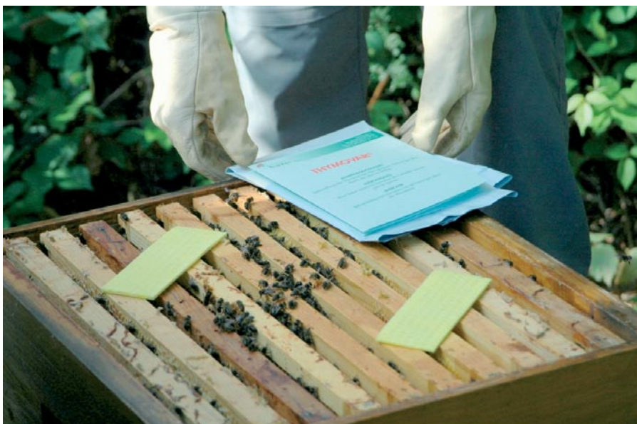
THYMOVAR®, un médicament vétérinaire à base de thymol destiné au contrôle du varroa

Nous constatons donc que tant du côté du miel que de celui des cires, le THYMOVAR® utilisé correctement ne conduit pas à la formation de résidus problé-