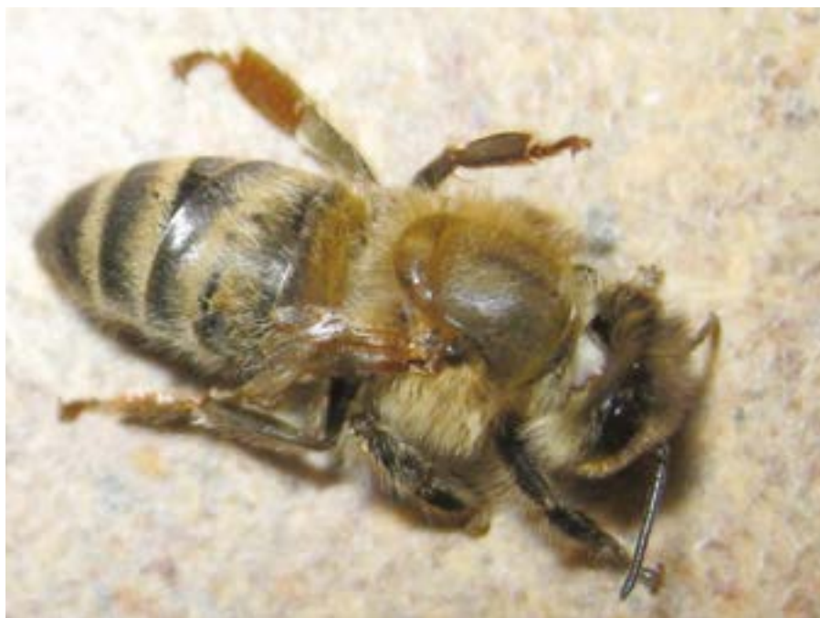
Abeille atteinte par le virus des ailes déformées

* Nous n'évoquerons pas le diptère Braula coeca , qui n'a jamais été un parasite dangereux mais plutôt un commensal de l'abeille mellifère, aujourd'hui presque disparu, victime collatérale des traitements anti-varroas. On le trouve encore dans les ruches de l'île d'Ouessant.