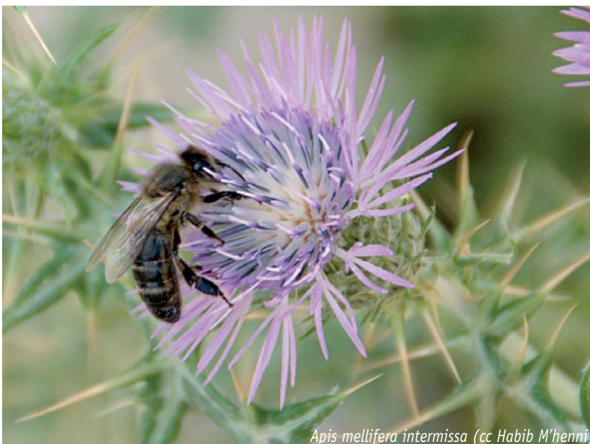
Apis mellifera intermissa

Cette abeille égyptienne a été découverte en Afrique du Nord-Est (Égypte, Soudan) le long de la vallée du Nil. D'après des dessins datant de 2600 avant J.C., elle est considérée comme la première abeille « utilisée » par l'homme. C'est une très belle abeille blanche dotée de poils gris sur le thorax et d'un abdomen recouvert de bandes jaunes aux bords noirs. Elle est considérée, du fait de sa couleur, comme la « race primaire » à partir de laquelle ont dérivé les races jaunes d'Afrique, d'Orient et également A.m. ligustica , l'abeille italienne. L'abeille égyptienne est une des plus petites abeilles mellifères observées. La colonie ne propolise pas. Elle produit une grande quantité de cellules royales (entre 50 et 260 cellules). Tant qu'aucune reine n'est fécondée, plusieurs reines vierges peuvent coexister dans la colonie et essaime ensemble. Un essaim peut contenir jusqu'à 30 reines. Le temps de développement des individus est plus court que celui des races européennes : 19,4 jours pour une ouvrière et 15,4 jours pour une reine. En été, les colonies sont attaquées par Vespa orientalis et aucun mécanisme de défense ne semble exister.