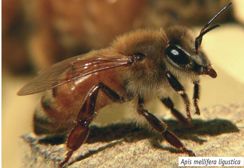
Apis mellifera ligustica

Apis mellifera ligustica (Spinola, 1806) ou abeille italienne. C'est la race d'abeille mellifère la plus distribuée dans le monde. La raison de ce succès tient à son caractère adapta-